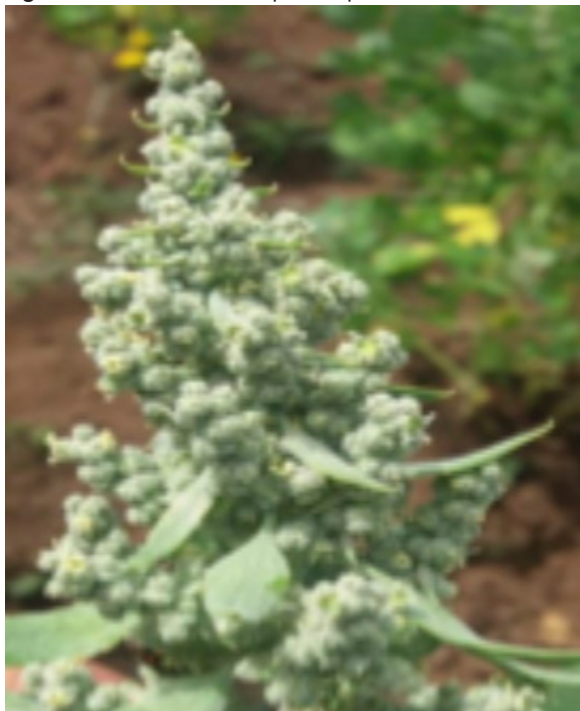
Figura 11. Floración en ecotipos de quinua