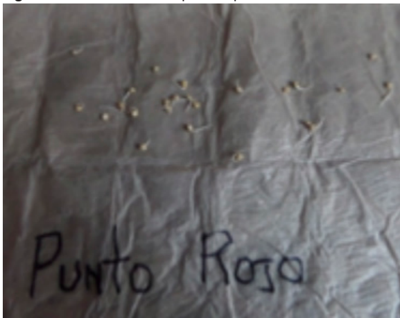
Figura 2. Germinación ecotipos de quinua.