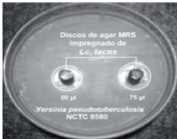
Figura 2. Discos de agar impregnados Lactococcus lactis subsp. lactis