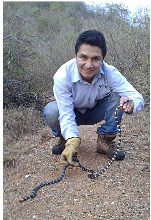
Figura 1. Captura de Micrurus mipartitus anomalus (MHNUC-HE-Se-0690) en el municipio de El Agrado, departamento del Huila, Colombia.

El individuo de mayor tamaño (Fig. 1) fue colectado y medido nuevamente para tener un valor más exacto y se encuentra depositado en la colección herpetológica del Museo de Historia Natural de la Universidad del Cauca (número de campo: LVP 0311), mientras que el segundo individuo se