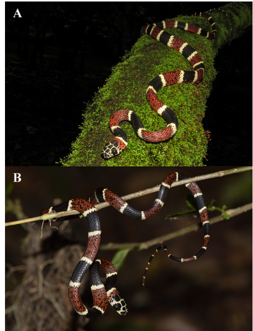
Figura 1. Rhinobothryum bovallii . Macho adulto del municipio de Gigante, Huila (A); juvenil del corregimiento La Victoria de San Isidro, municipio de La Jagua de Ibirico, Cesar (B).

Se reporta por primera vez la presencia de R. bovallii para el departamento del Huila a través de un individuo capturado el 9 de abril de 2017 en el municipio de Gigante (Fig. 1A). Se obtuvo el segundo registro para la serranía del Perijá, en el municipio de La Jagua de Ibirico, departamento del