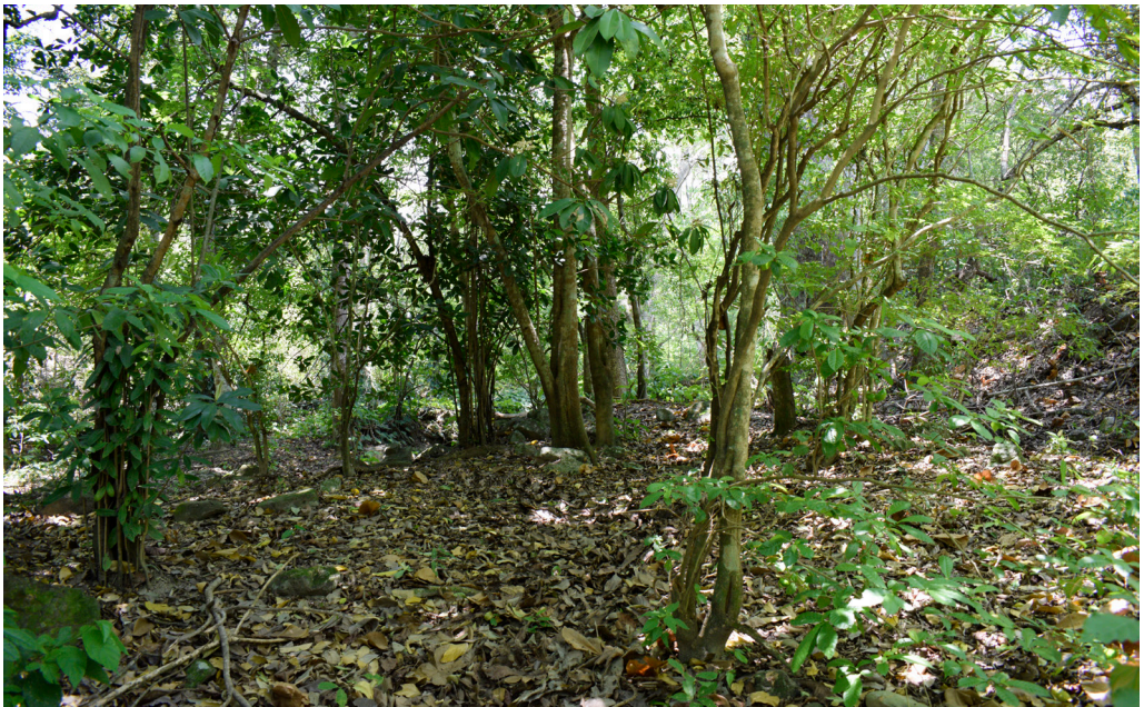
Figura 4. Bosque seco tropical en la vereda Zumbador Bajo, corregimiento La Victoria de San Isidro, municipio de La Jagua de Ibirico, Cesar.

R. bovallii (ver Pazmiño-Otamendi, 2019), coincidimos también con el criterio de otros autores con respecto a que es una especie raramente observada (Savage, 2002; Köhler, 2003; Rojas-Morales, 2012). Según Arredondo et al. (2017), esta baja tasa de encuentro puede estar relacionada con un esfuerzo de muestreo inadecuado, teniendo en cuenta que la especie es principalmente de actividad nocturna y de hábitos tanto terrestres como arbustivos que incluso alcanzan el dosel (Savage, 2002; Pazmiño-Otamendi, 2019). De hecho, el individuo registrado en la localidad 2 (Tabla 1) fue observado mientras ascendía en un árbol de Ceiba sp. de gran porte, utilizando sus púas como soporte. Por otra parte, el individuo de la localidad 1 se encontró a 2,5 m de