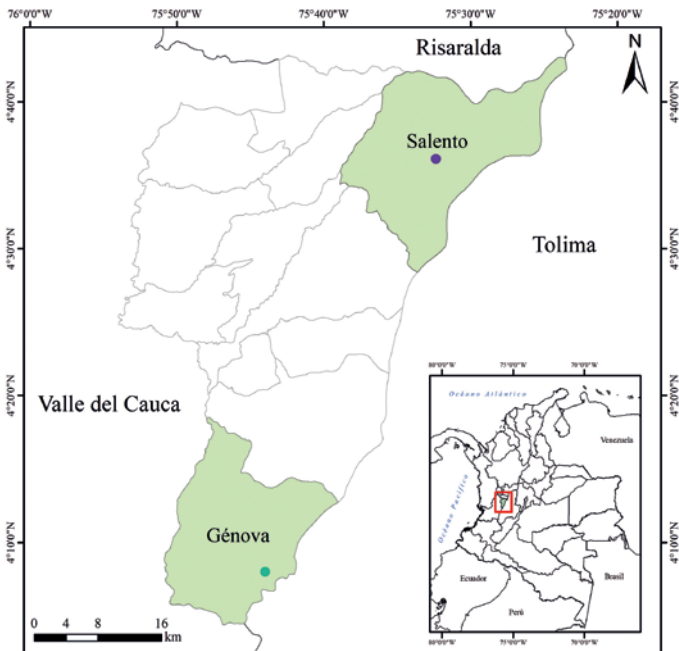
Figura. 1. Localización geográfica de los registros del género Histiotus en el departamento del Quindío, Colombia.

del género Histiotus , en la Finca Alegrías ( 04^{\circ}36'07'' N y 75^{\circ}32'22'' O, 2581 msnm) del municipio de Salento (Fig. 1). El individuo no fue colectado por falta de elementos que permitieran su preservación y transporte. Sin embargo, con el ánimo de documentar la descripción del murciélago, se realizó el registro fotográfico del individuo, en el que se apreciaron algunas de sus características morfológicas, las cuales, a pesar de las condiciones fortuitas del episodio, se registraron en combinación con la estimación de medidas anatómicas del individuo, permitiendo su identificación hasta el nivel de género, con el apoyo de un grupo de expertos.